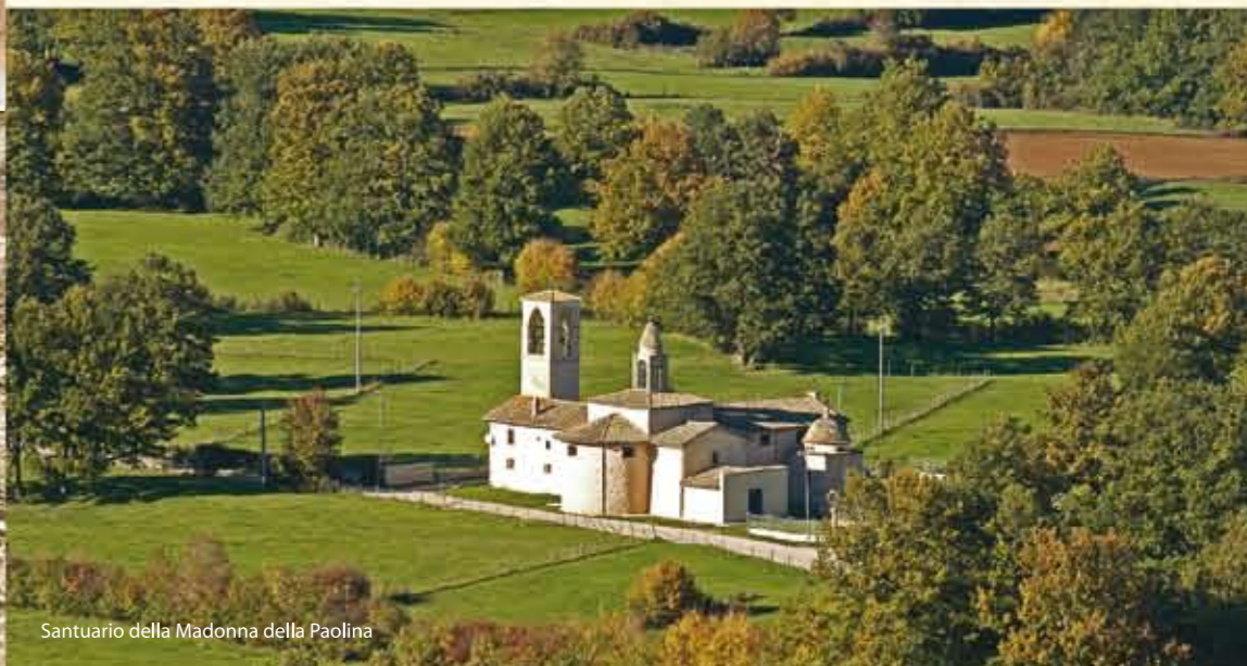
Santuario della Madonna della Paolina

Oltre alle particolari caratteristiche legate al tipo stesso di costruzione e di suddivisione degli spazi, appare notevole il fatto che questo settore non venga abbandonato, come invece accaduto per il foro, ma che attesti una frequentazione ancora in età longobarda, come dimostrano due tombe, probabilmente dell'epoca, venute alla luce durante gli scavi.