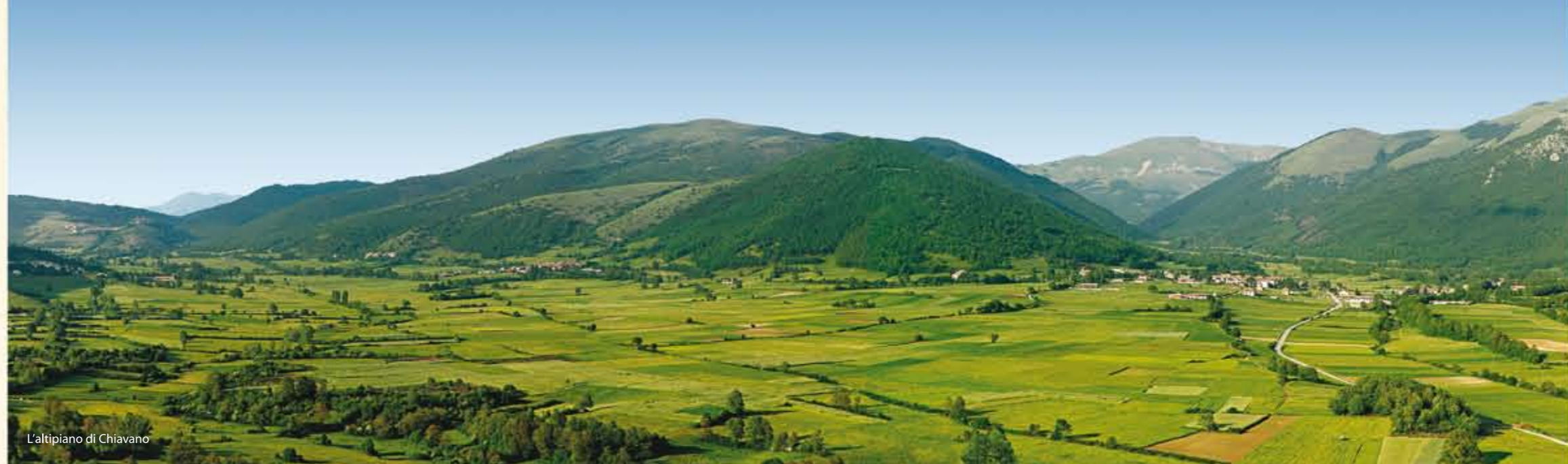
L'altipiano di Chiavano

Partendo da questi elementi, la campagna dell'agosto 2007 ha portato alla luce un settore del foro che circondava il tempio. Quest'ultimo risulta, dunque, al centro del lato corto posteriore di una vasta piazza delimitata da colonne in laterizio, la quale doveva misurare all'incirca 120 m x 60 (fig. 3). Del foro è stato messo in luce un quarto della superficie, tra cui una serie di ambienti corrispondenti, probabilmente, alla parte a vocazione commerciale, un piccolo sacello absidato, da connettersi a forme di culto, ed una struttura idraulica, forse una cisterna, che si affaccia all'esterno del foro (figg. 4 - 5). Le strutture emerse, ancora in fase di studio, rivelano che il foro, come il tempio, ebbe diverse fasi edilizie, mentre i reperti rinvenuti mostrano che l'area fu frequentata dal III al I secolo a.C. Appare naturale collegare, dunque, la costruzione del foro con l'imporsi della dominazione di Roma (avvenuto con il console Curio Dentato nel 290 a.C.), che, per assicurarsi il controllo sul territorio, im-pianta un forum in un'area in cui una popolazione prevalentemente