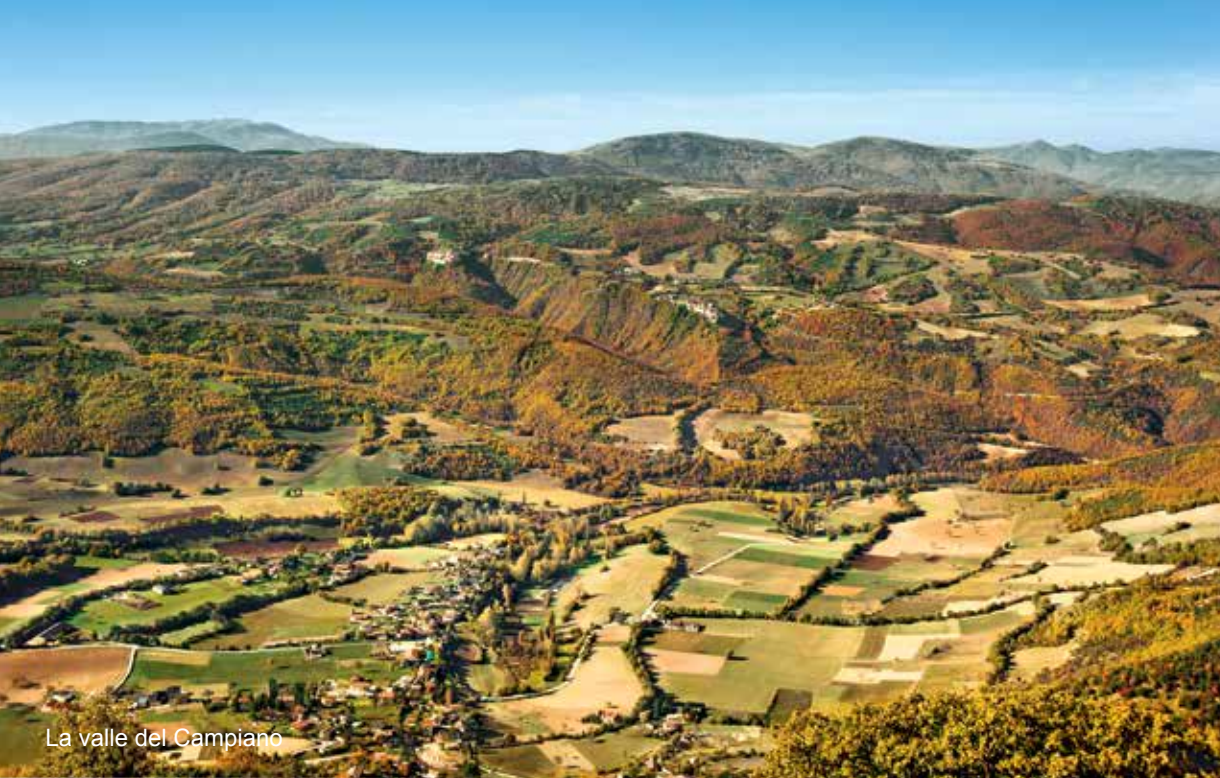
La valle del Campiano