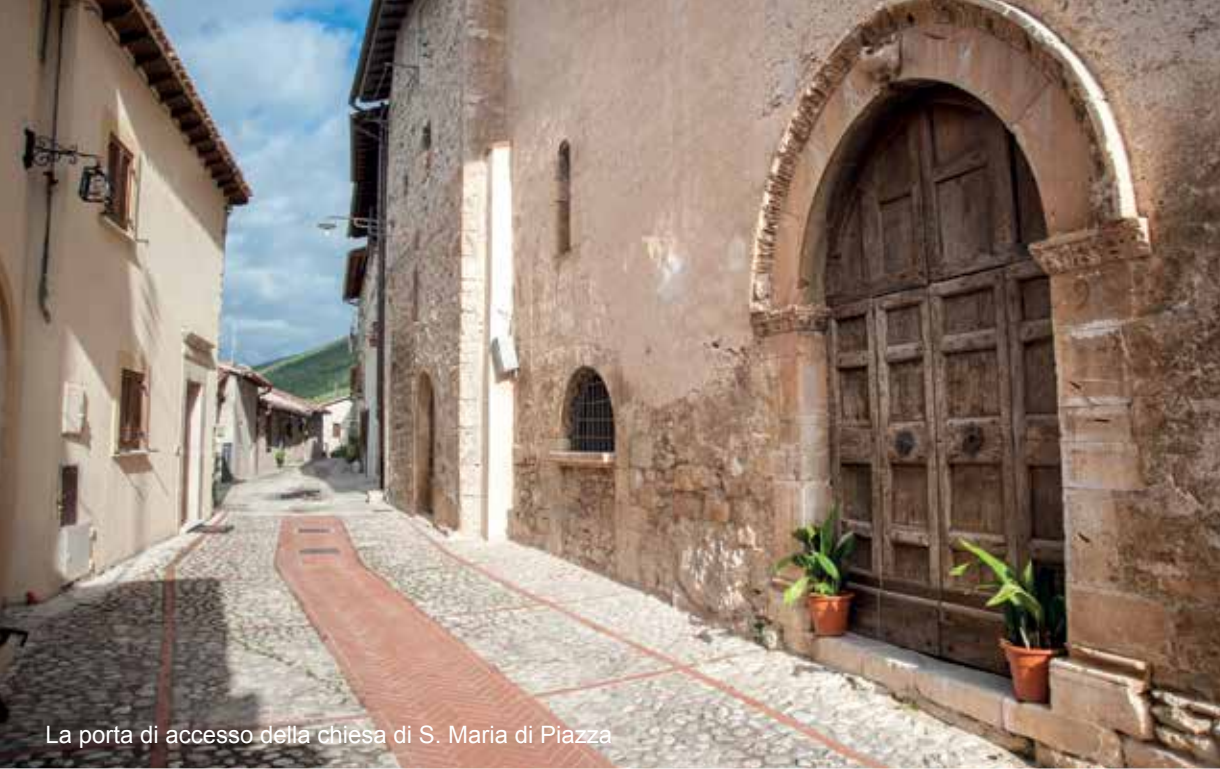
La porta di accesso della chiesa di S. Maria di Piazza