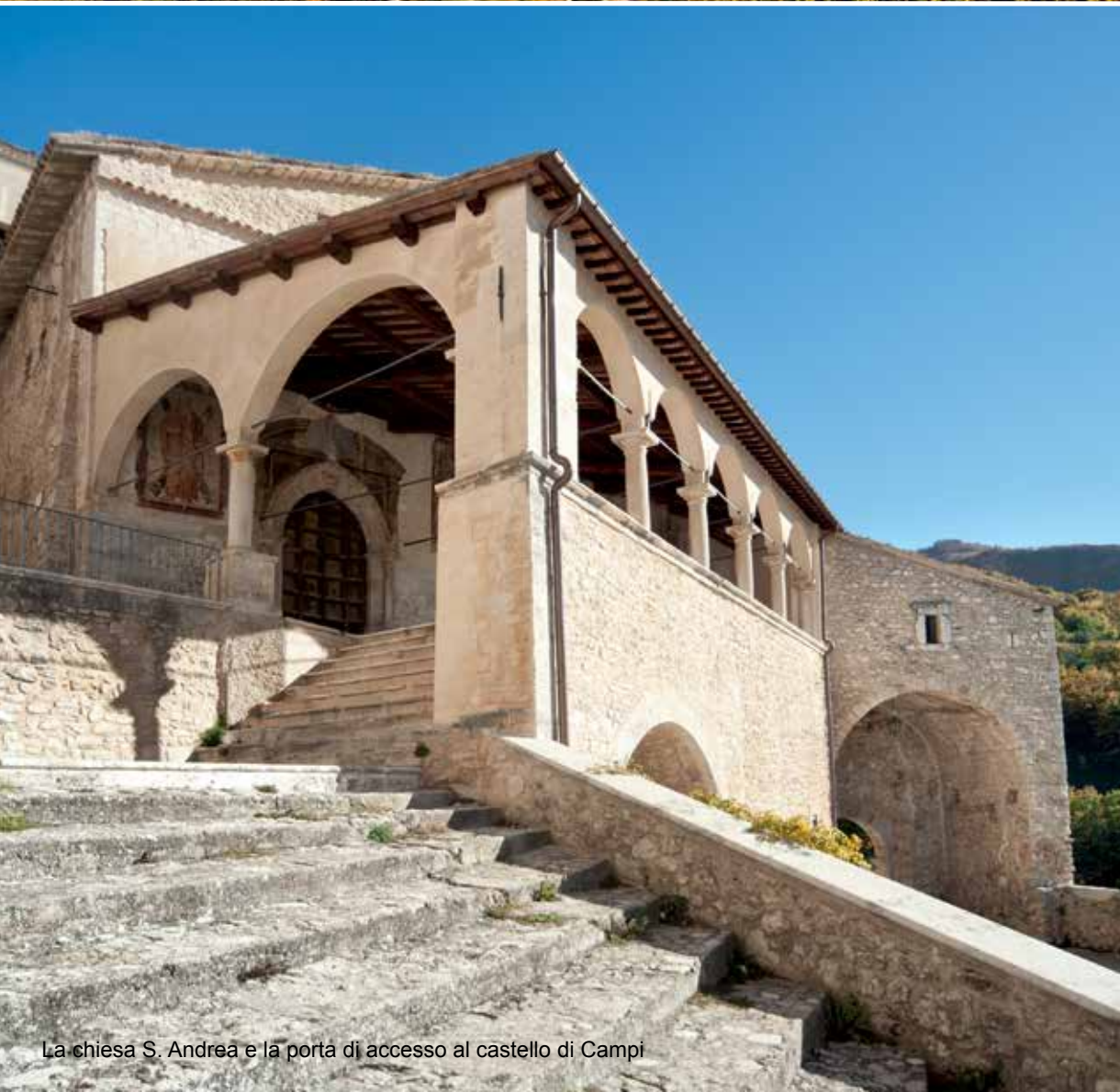
La chiesa S. Andrea e la porta di accesso al castello di Campi