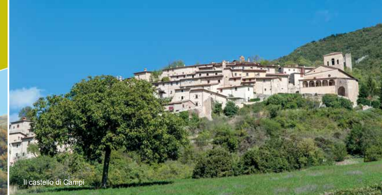
Il castello di Campi