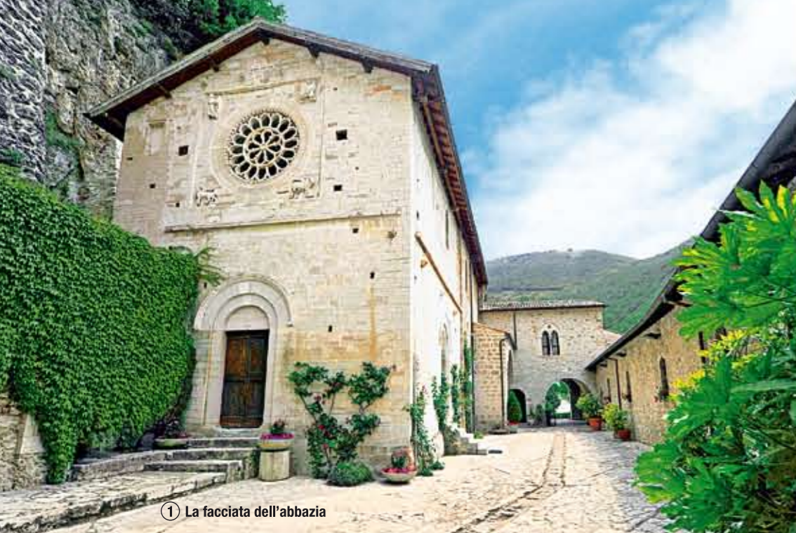
① La facciata dell'abbazia