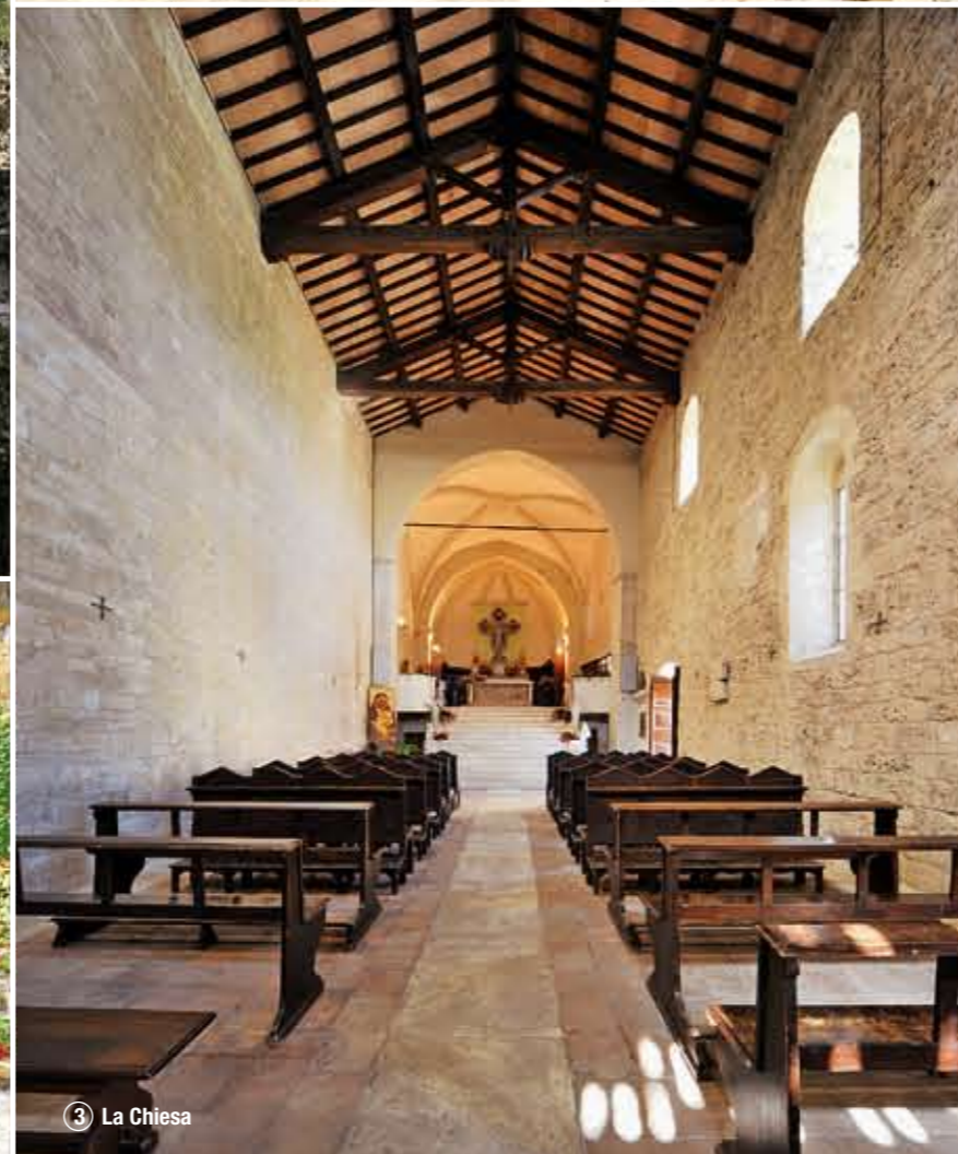
③ La Chiesa