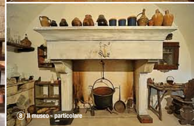
⑧ Il museo - particolare