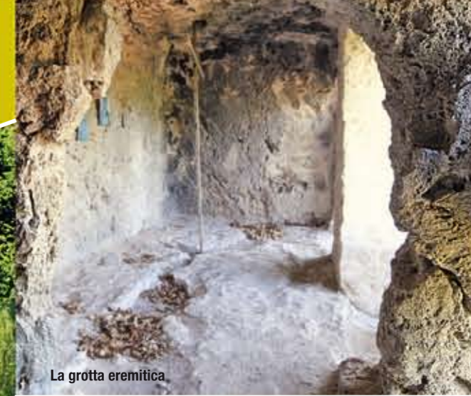
La grotta eremitica