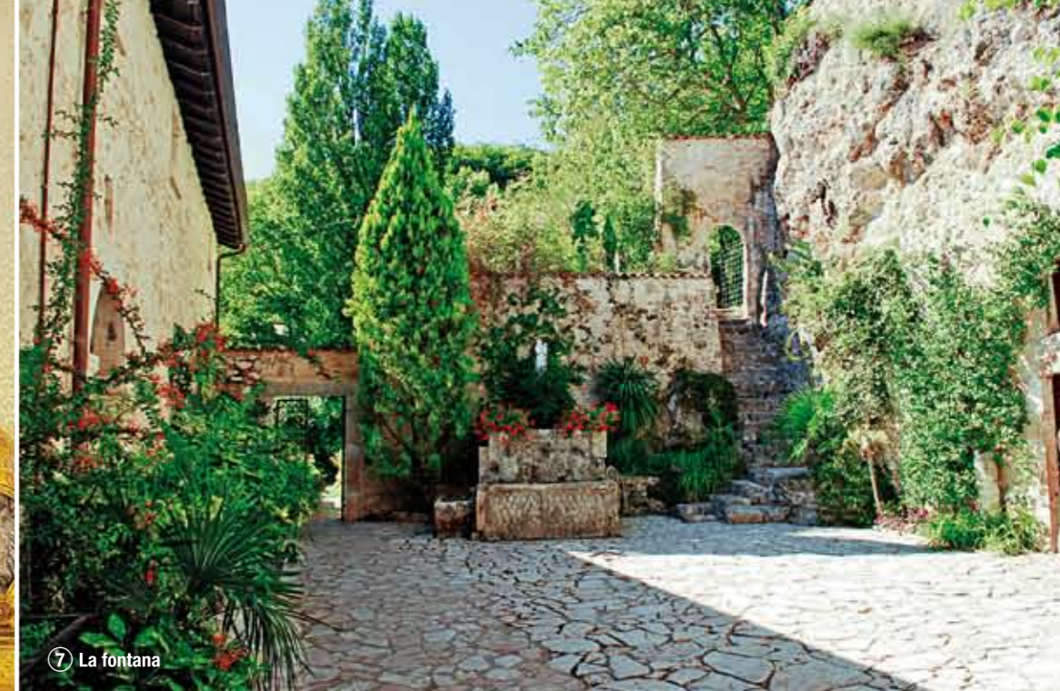
⑦ La fontana