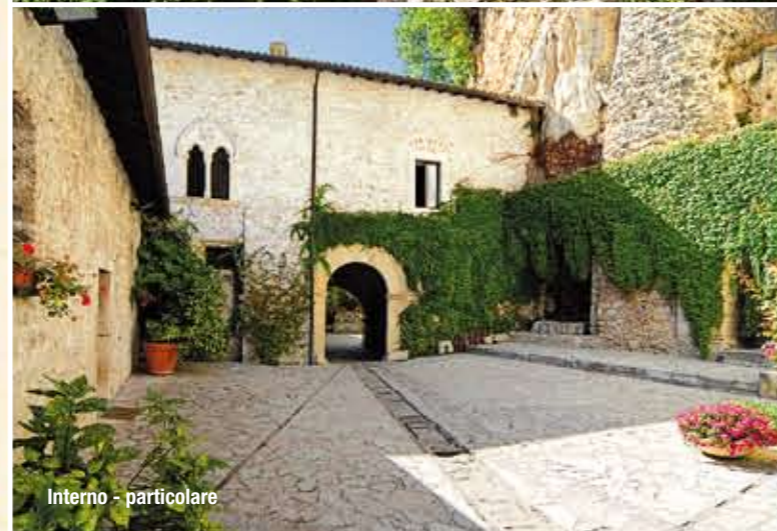
Interno - particolare