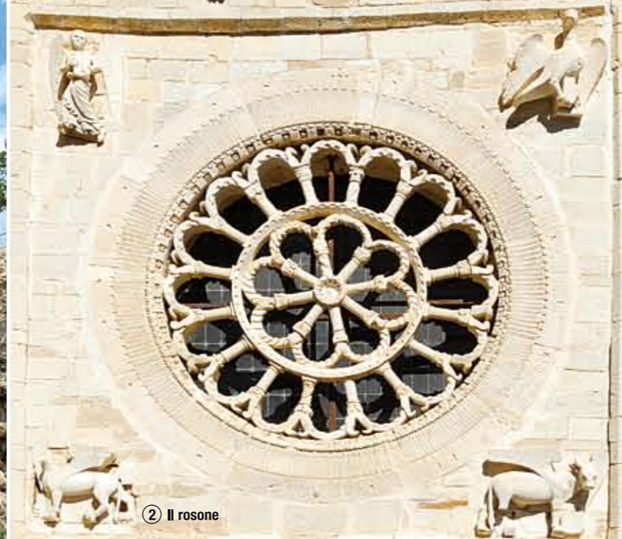
② Il rosone