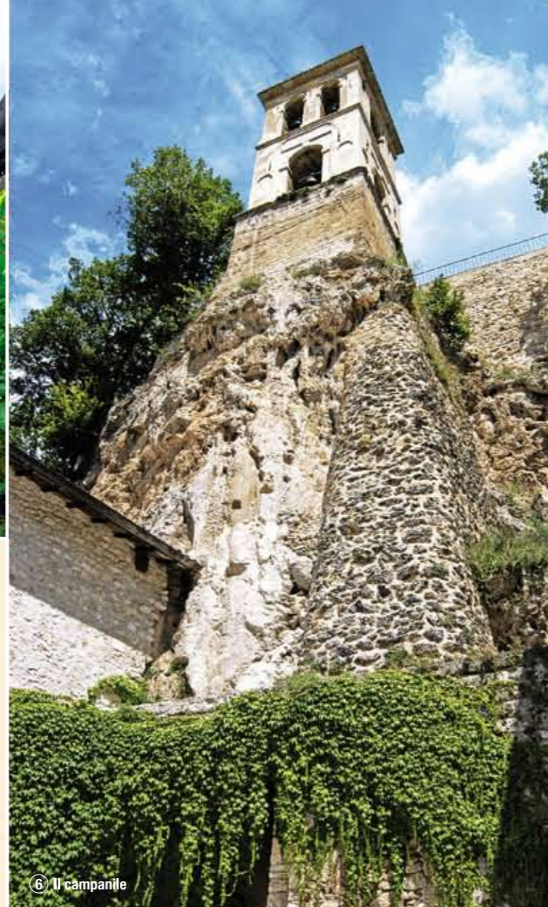
⑥ Il campanile